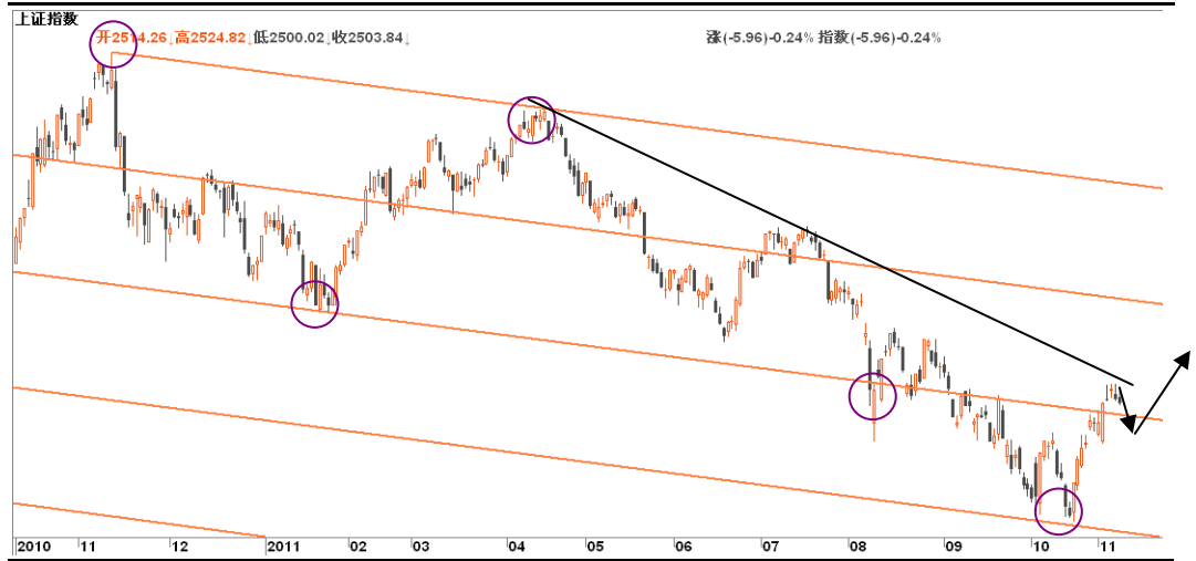
图4-1:上证日线图:多空围绕上证2500一带的“缺口+60日均线+10日均线”进行争夺